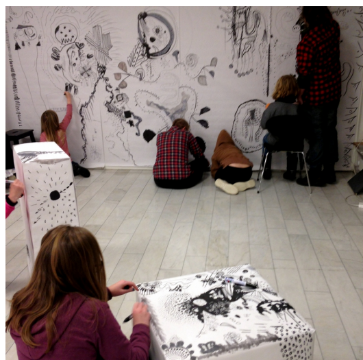
Ovan: "prickar, streck och lite till" BOMO10+ , Borlänge.