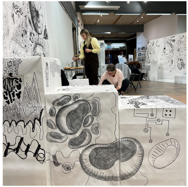
Konstlinjen Fornby folkhögskola, offentlig miljö, Rättviks kulturhus