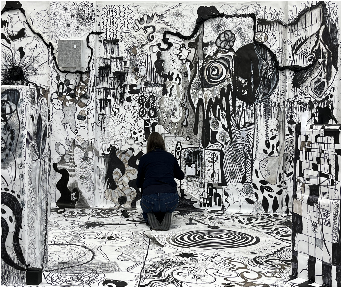
Konstkursen Fornby folkhögskola , Borlänge

Den grafiska linjen och det vita pappret är grundstenarna i teckning och här tar vi vårt avstamp. På ett lekfullt sätt utforskar vi tillsammans det kollektiva tecknandet och dess potential. Vi tecknar stort och smått, uppe och nere och runt om. Vi byter plats med varandra, släpper mitt och låter det bli ditt. Vi utmanar våra föreställningar och hittar nya oväntade möten genom kreativ frihet och konstnärligt tänkande.