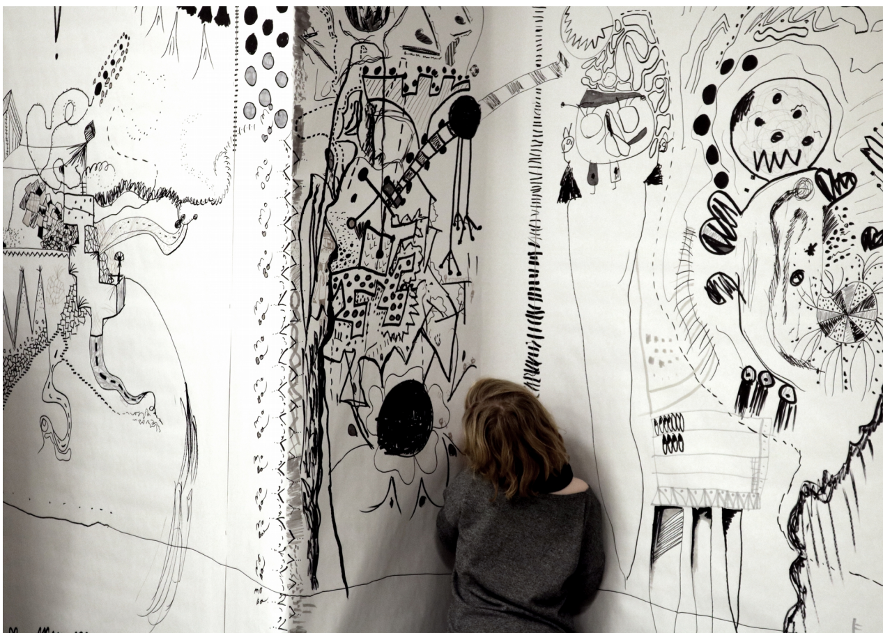
Nedan: "prickar, streck och lite till" BOMO10+ , Borlänge.