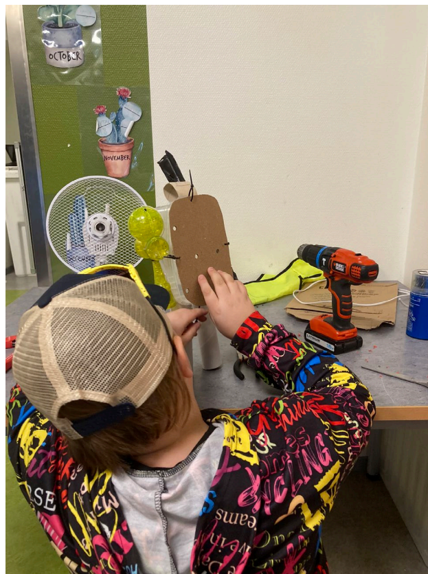
Process, Sätters Kommun 2024