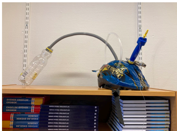
Sätters Kommun 2024