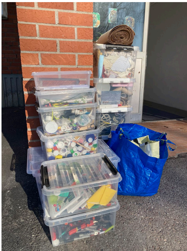
Material och verktyg inför skapande skola projekt i Sätters Kommun åk 4, VT 2022.

ANTAL DELTAGARE: Max 20 per grupp, i samspel med ordinarie lärare. Max 10 vid aktivitet utanför skolan.