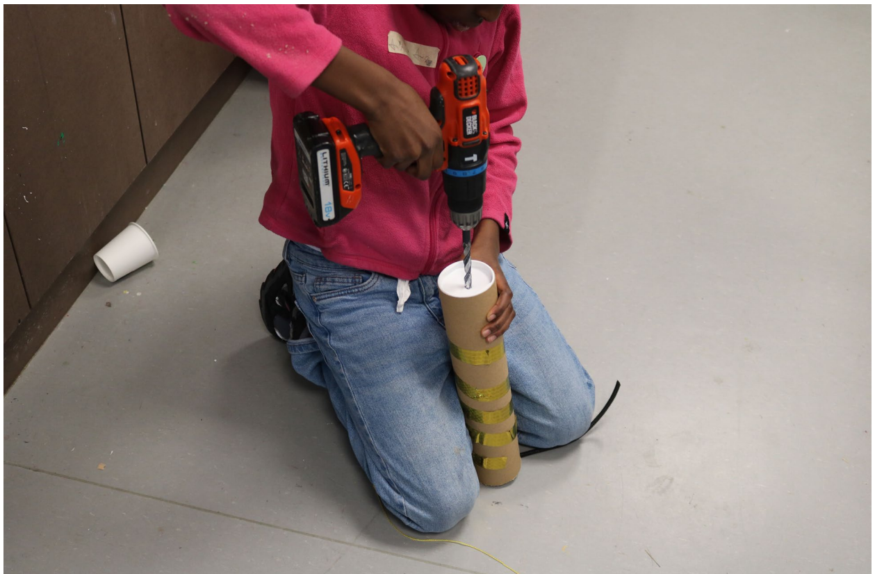
Designprocess: Vad är en mobil forsknings och Skaparstation? Workshops, 7-12 år, i samband med examensprojekt, MA Child Culture Design. Kulturhuset 1014, 2024.