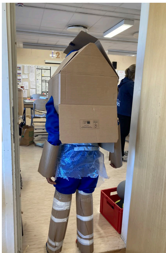
Skapande direkt på kroppen, Sätters Kommun 2024