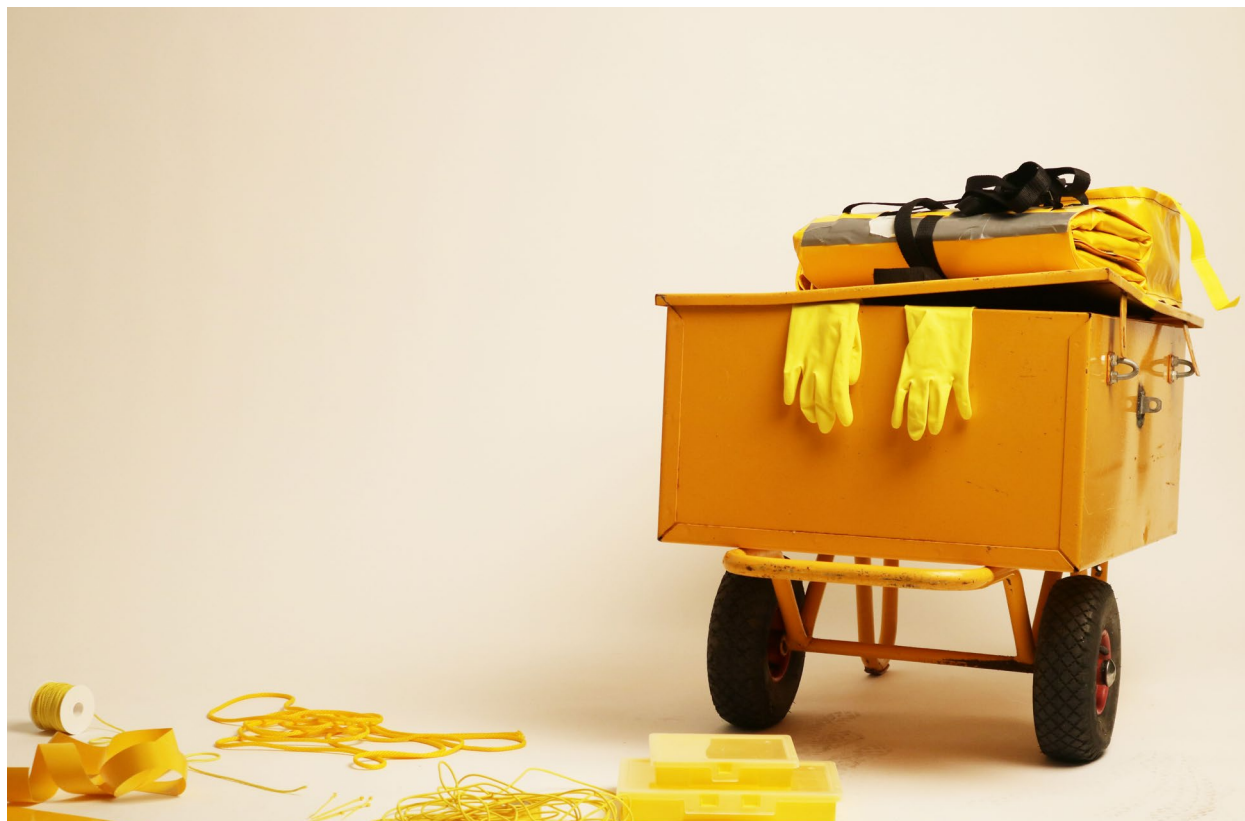
A Portable Research and Making Station, (HDK Valand 2024). Vill ni utforska en plats eller en fråga genom konstnärliga metoder?

Max 20 per grupp, i samverkan med ordinarie lärare. Max 10 vid aktivitet utanför skolan.